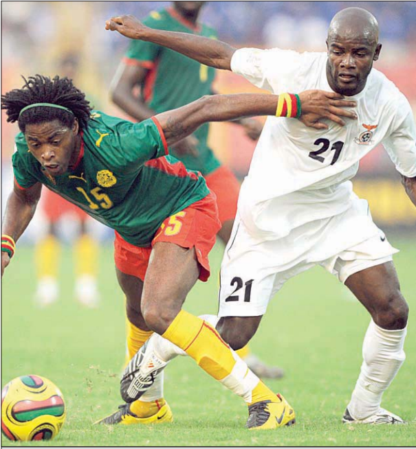
من لقاء الكامبيرون وزامبيا